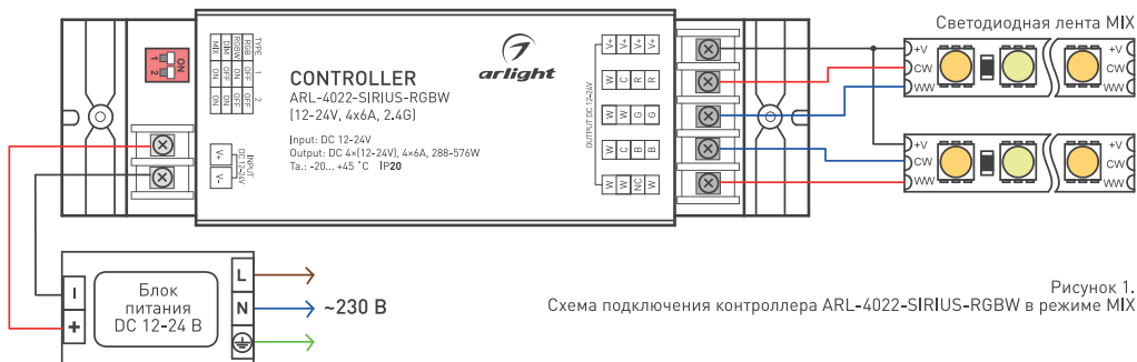
Рисунок 1. Схема подключения контроллера ARL-4022-SIRIUS-RGBW в режиме MIX