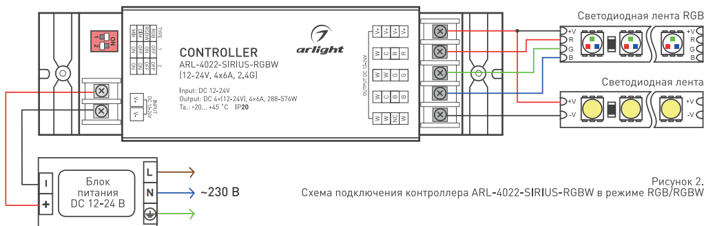
Рисунок 2. Схема подключения контроллера ARL-4022-SIRIUS-RGBW в режиме RGB/RGBW