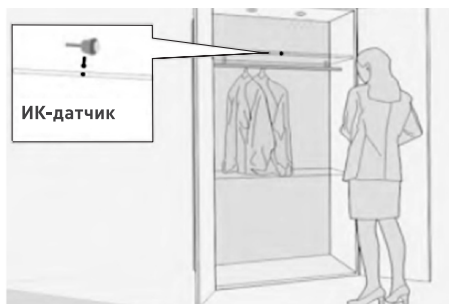
Вариант установки SR2-Hand