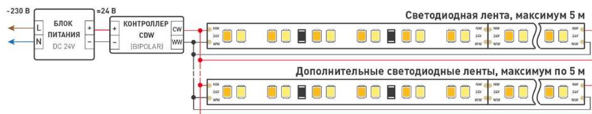
Схема 2. Подключение нескольких светодиодных лент с двух сторон.

Рекомендуется использовать для обеспечения равномерного свечения ленты по всей длине.