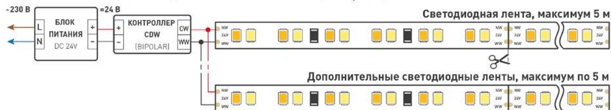
Схема 1. Подключение нескольких светодиодных лент с одной стороны.

Максимальная длина подключения ленты – 5 м (1 катушка).