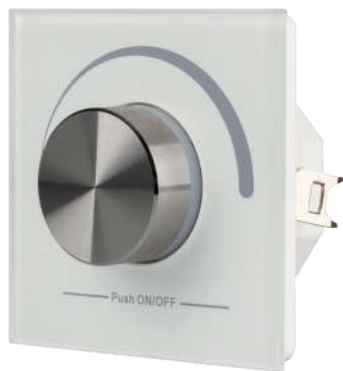
022516 Панель Rotary SR-2836N-B-RF-IN