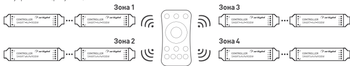
Рисунок 3. Вариант построения системы с 4-зонным пультом дистанционного управления