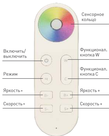
Рисунок 1. Назначение кнопок пульта управления ARL-SIRIUS-MULTI White

Примечание. В связи с периодическим обновлением встроенного программного обеспечения (прошивки), а также из-за особенностей используемого контроллера алгоритм работы пульта может несколько отличаться от приведенного. Обновленные инструкции к новым версиям оборудования Вы можете найти на сайте arlight.ru .