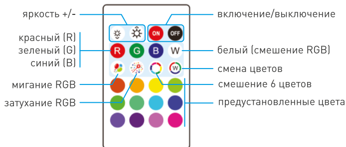
Рисунок 2. Назначение кнопок на пульте SMART-MINI-RGB-SET