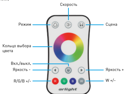
Рисунок 2. Назначение кнопок на пульте управления