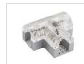
Соединитель тройной Арт. 022703 ARL-CLEAR-U15-2x90 (26x15mm)