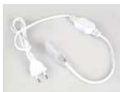
Шнур питания Арт. 021547 ARL-Power-220V (26x15mm)