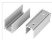
Держатель Арт. 021551 ARL-U15-Clip (26x15mm)