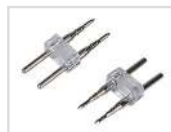
Силовой коннектор Арт. 021241 ARL-2pin