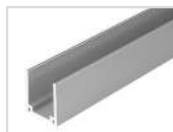
Профиль Арт. 021555 ARL-U15 (26x15mm)