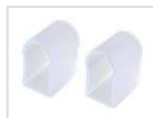
Заглушка Арт. 021240 ARL-U15-Cap