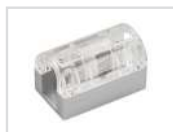
Соединитель прямой Арт. 022701 ARL-CLEAR-U15-Line (26x15mm)