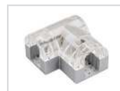
Соединитель угловой Арт. 022702 ARL-CLEAR-U15-90 (26x15mm)