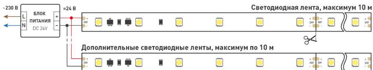
Схема подключения нескольких светодиодных лент с одной стороны.

Максимальная длина подключения ленты – 10 м (1 катушка).