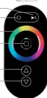
Рисунок 1. Внешний вид пульта дистанционного управления и назначение органов управления.