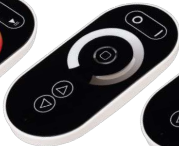
ARL-1022-SIRIUS-DIM Арт. 027146