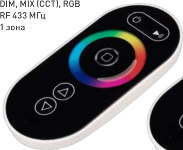
ARL-1022-SIRIUS-RGB Арт. 023170