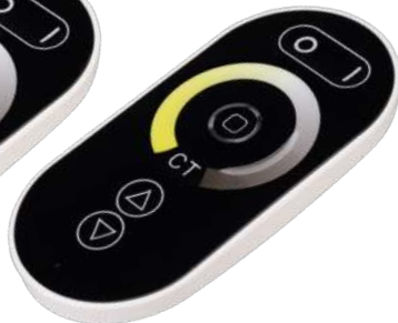
ARL-1022-SIRIUS-MIX Арт. 027147