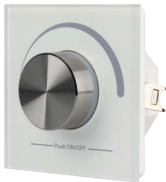
022516 Панель Rotary SR-2836N-B-RF-IN