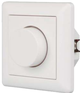
022155 Панель Rotary SR-2836N-A-RF-IN