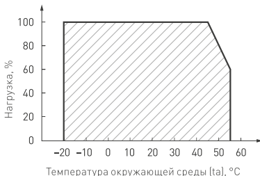
Рис. 3. Максимальная допустимая нагрузка, % от мощности источника