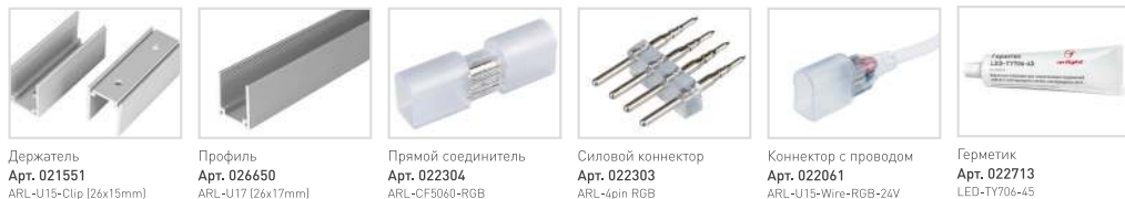
Держатель Арт. 021551 ARL-U15-Clip (26x15mm)