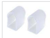
Заглушка Арт. 021240 ARL-U15-Cap