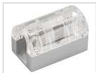
Соединитель прямой Арт. 022701 ARL-CLEAR-U15-Line (26x15mm)