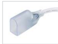
Коннектор с проводом Арт. 021242 ARL-U15-Wire-24V