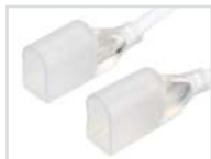
Коннектор с проводом Арт. 026094 ARL-U15-TWIN-1000-24V