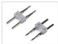
Силовой коннектор Арт. 021241 ARL-2pin