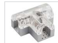
Соединитель тройной Арт. 022703 ARL-CLEAR-U15-2x90 (26x15mm)