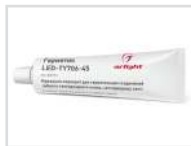
Герметик Арт. 022713 LED-TY706-45