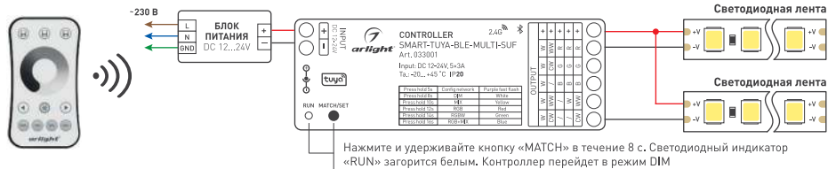
Рисунок 1. Схема подключения контроллера SMART-TUYA-BLE-MULTI-SUF