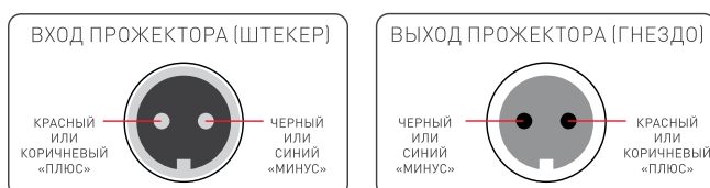
Цоколевка коннекторов на кабелях питания