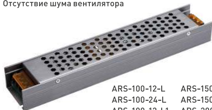
ARS-100-12-L ARS-150-12-L ARS-100-24-L ARS-150-24-L ARS-100-12-L1 ARS-200-12-L ARS-100-24-L1 ARS-200-24-L