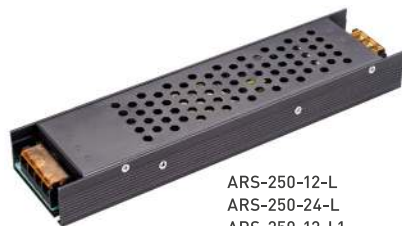
ARS-250-12-L ARS-250-24-L ARS-250-12-L1 ARS-250-24-L1