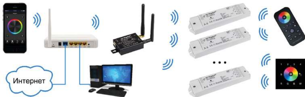
Рис. 2. Подключение через роутер с использованием домашней сети Wi-Fi.

3.3. Подключите к входу питания DC 12–24V конвертера (Рис. 3) провода от стабилизированного блока питания с соответствующим напряжением. Соблюдайте полярность подключения.