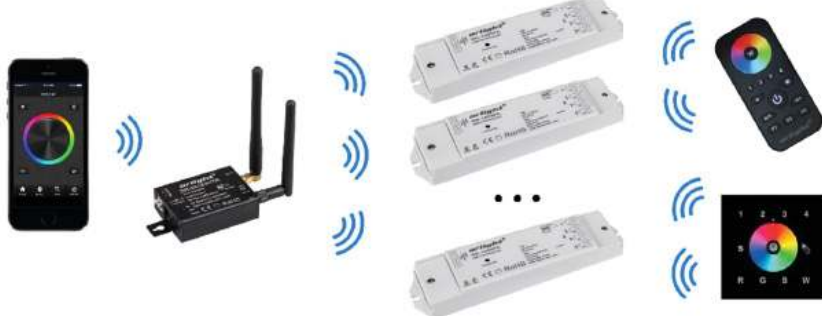
Рис. 1. Прямое подключение мобильного устройства к конвертеру (без использования домашней сети).

3.2. Выберите схему предполагаемого использования конвертера (Рис. 1 или Рис. 2).