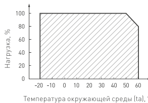
Температура окружающей среды (Tamb), °С Рис. 3. Максимальная допустимая нагрузка, % от мощности источника