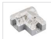
Соединитель угловой Арт. 022702 ARL-CLEAR-U15-90 (26x15mm)