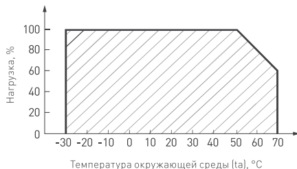
Температура окружающей среды (t a ), °C