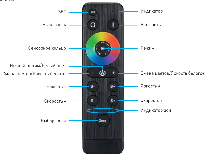
Рисунок 1. Назначение кнопок пульта управления ARL-STICK-DIM