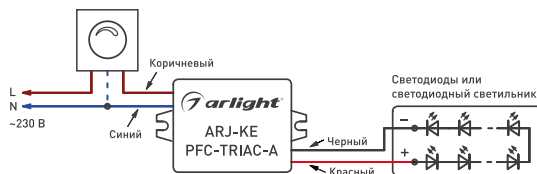
Рис. 1. Подключение источника тока

ВНИМАНИЕ! Не допускается подключение светильника к работающему драйверу. Это может привести к отказу светильника.