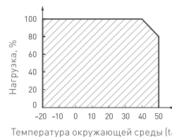
Рис. 3. Максимальная допустимая нагрузка, % от мощности источника