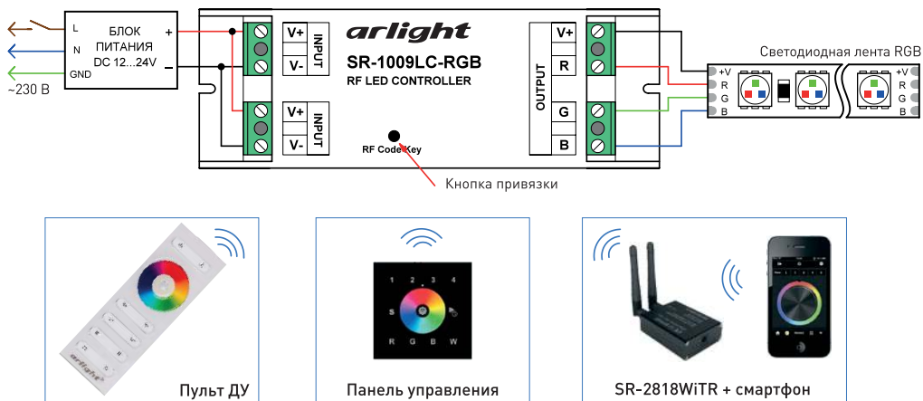
Рис. 2. Схема подключения оборудования на примере контроллера SR-1009LC-RGB.