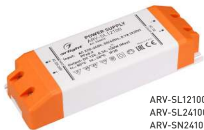
ARV-SL12100 ARV-SL24100 ARV-SN24100-PFC-C