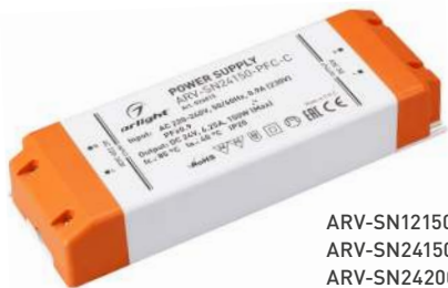
ARV-SN12150-PFC-C ARV-SN24150-PFC-C ARV-SN24200-PFC-C