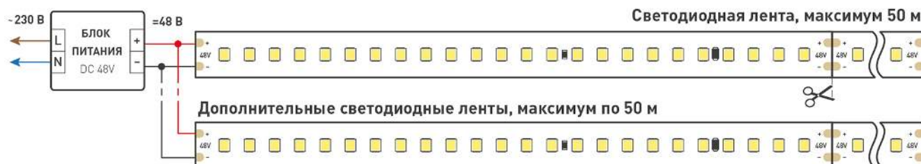
Схема подключения нескольких светодиодных лент с одной стороны.

Максимальная длина подключения ленты – 50 м (1 катушка).