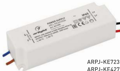
ARPJ-KE72350A ARPJ-KE42700A ARPJ-KE60700A ARPJ-KE401050A