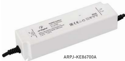
ARPJ-KE86700A ARPJ-KE571050A ARPJ-KE421400A