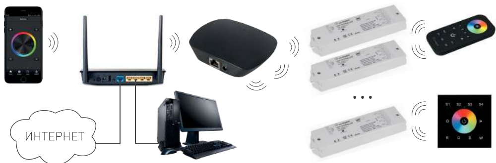
Рисунок 2. Подключение через роутер с использованием домашней сети Wi-Fi.