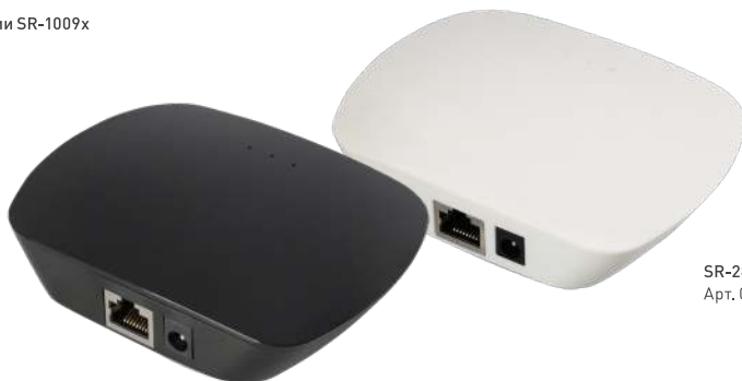
SR-2818WiN Black Арт. 020955