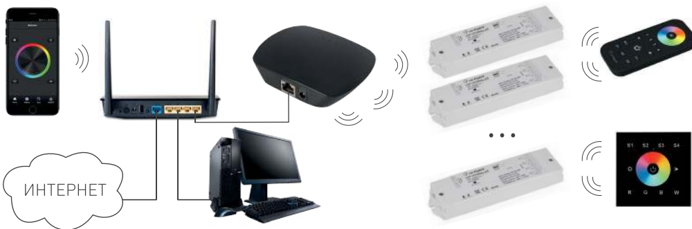
Рисунок 3. Подключение через роутер с использованием проводного соединения.

3.3. Подключите разъем сетевого адаптера к гнезду питания конвертера.