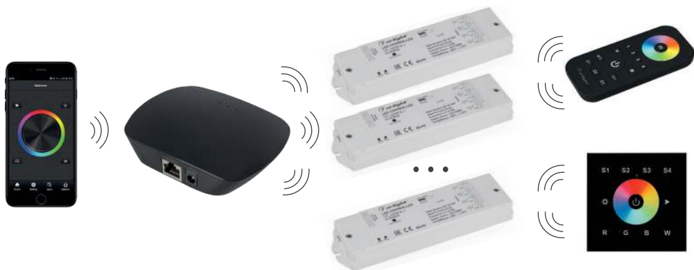
Рисунок 1. Прямое подключение смартфона к конвертеру (без использования домашней сети Wi-Fi).

3.2. Подключите конвертер по одной из нижеприведенных схем.