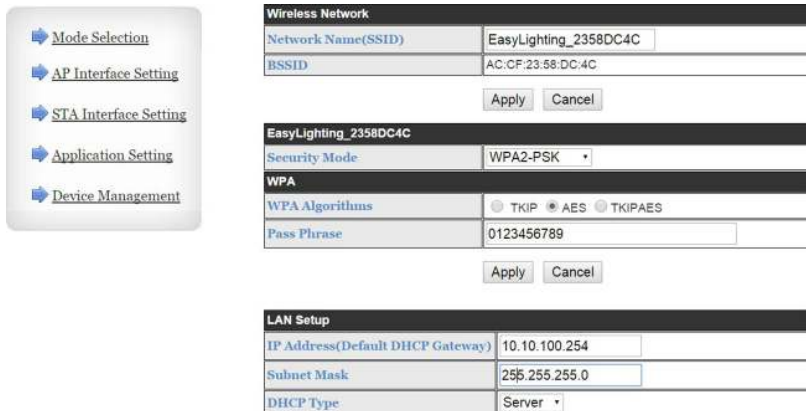
Рисунок 4. WEB-интерфейс конвертера.

3.10. При проводном подключении конвертера к роутеру и при включенном на роутере режиме DHCP, IP-адрес назначается конвертеру автоматически.