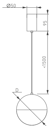
Рис. 1. Чертеж и габаритные размеры

* При соблюдении условий эксплуатации и снижении яркости не более чем на 30% от первоначальной.