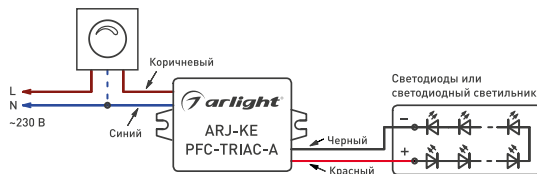
Рис. 1. Подключение источника тока

ВНИМАНИЕ! Не допускается подключение светильника к работающему драйверу. Это может привести к отказу светильника.