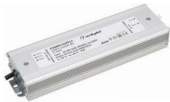
ARPV-12200-B1 ARPV-24200-B1 ARPV-24300-B1