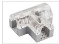
Соединитель тройной Арт. 022703 ARL-CLEAR-U15-2x90 (26x15mm)