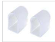
Заглушка Арт. 021240 ARL-U15-Cap