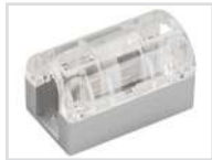
Соединитель прямой Арт. 022701 ARL-CLEAR-U15-Line (26x15mm)