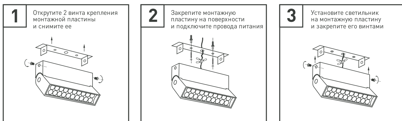
Рис. 2. Установка и подключение светильника