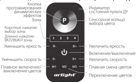
Рис.2. Управление контроллером с пульта ДУ.