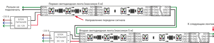
Рис. 1. Схема подключения ленты без использования внешнего контроллера (максимум 1024 пикселя, общий рисунок динамического эффекта при переходе с ленты на ленту сохраняется)