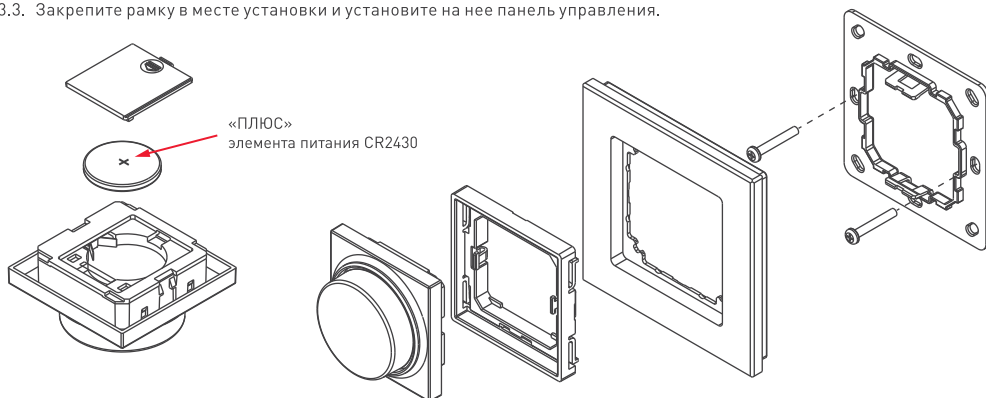
Рисунок 1. Схема установки панели.