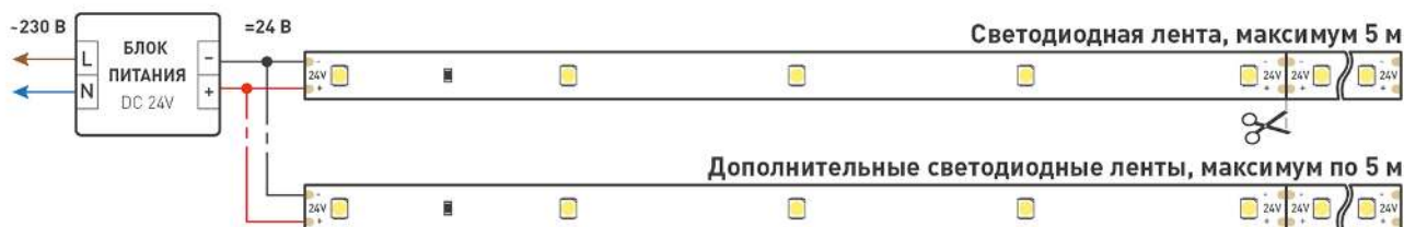
Схема 1. Подключение нескольких светодиодных лент с одной стороны.

Максимальная длина подключения ленты – 5 м (1 катушка).