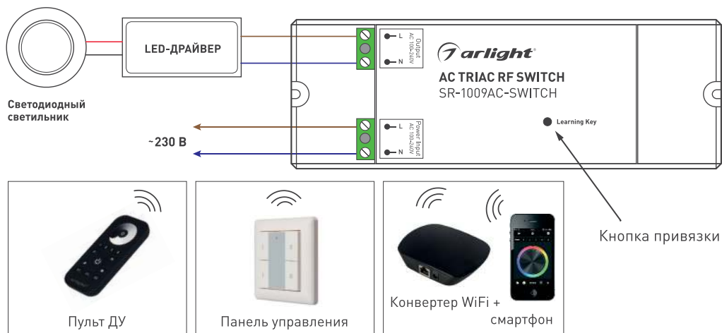
Рисунок 1. Схема подключения.