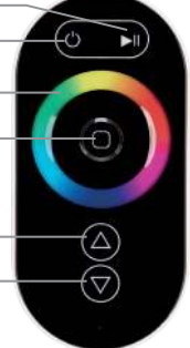
Рисунок 1. Внешний вид пульта дистанционного управления и назначение органов управления.

Примечание. В связи с обновлением встроенного программного обеспечения (прошивки), а также из-за особенностей используемого контроллера, алгоритм работы пульта может несколько отличаться от приведенного. Обновленные инструкции к новым версиям оборудования Вы можете найти на сайте arlight.ru .