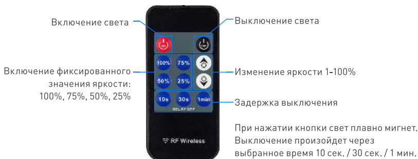
Рис. 2. Управление диммером.