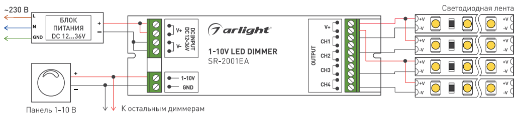
Рис. 2. Схема подключения SR-2001EA.