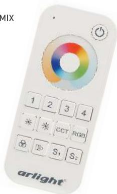
SMART-R20-MULTI White Арт. 023471