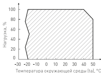
Рис. 3. Максимальная допустимая нагрузка, % от мощности источника