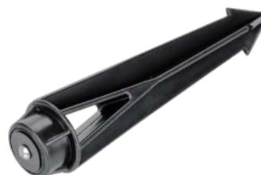
Рис. 4. Основание для установки в грунт (арт. 024889).