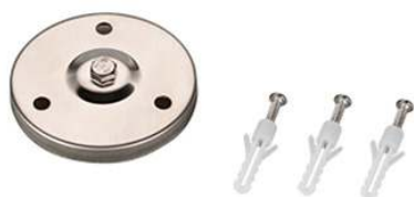
Рис. 3. Основание для установки на поверхность (арт. 024890).