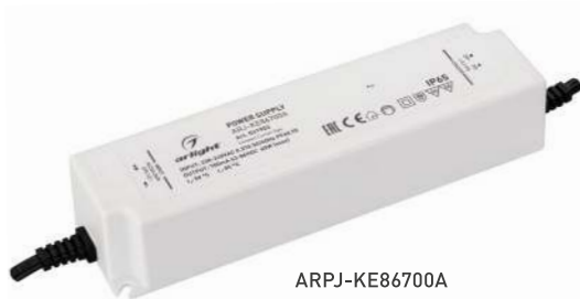
ARPJ-KE86700A ARPJ-KE571050A ARPJ-KE421400A