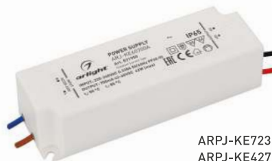
ARPJ-KE72350A ARPJ-KE42700A ARPJ-KE60700A ARPJ-KE401050A