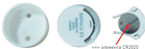
«+» элемента CR2025