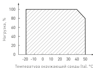
Рисунок 3. Максимальная допустимая нагрузка, % от мощности источника