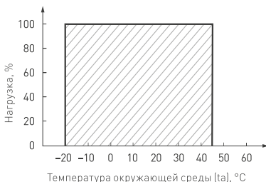
Рис. 3. Максимальная допустимая нагрузка, % от мощности источника