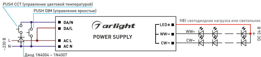
Рис. 3. Пример подключения функции PUSH DIM, PUSH CCT без выхода CCT на источнике питания* (*Подключение функций PUSH DIM, PUSH CCT для артикулов 047031 и 048241).