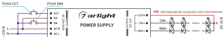
Рис. 2. Пример подключения функции PUSH DIM, PUSH CCT

Для блоков питания, не имеющих отдельного выхода CCT реализация функции PUSH CCT выполняется применением ограничивающего диода типа 1N4004 (см. рис. 3).